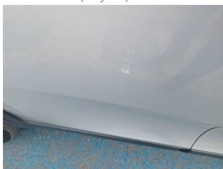
Porte arrière droite (Rayure)