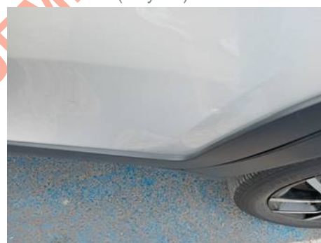
Porte arrière gauche (Rayure)