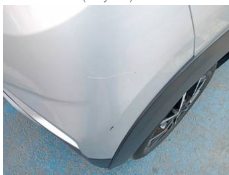
Bouclier arrière (Rayure)