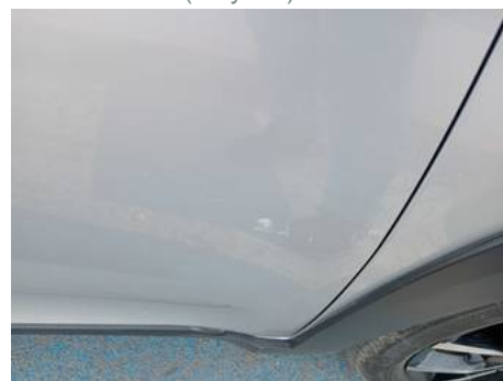
Porte avant droite (Rayure)